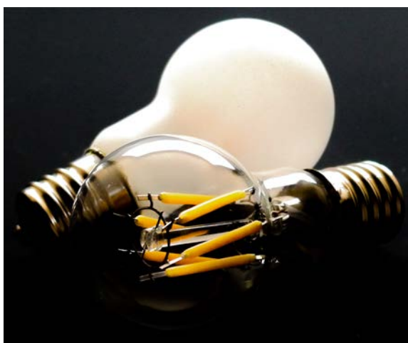
PS35 (ミニクリプトン球) タイプ 奥が PS35F-3.5WD9227-E17 (フロスト) 手前は PS35-3.5WD9227-E17 (クリア)