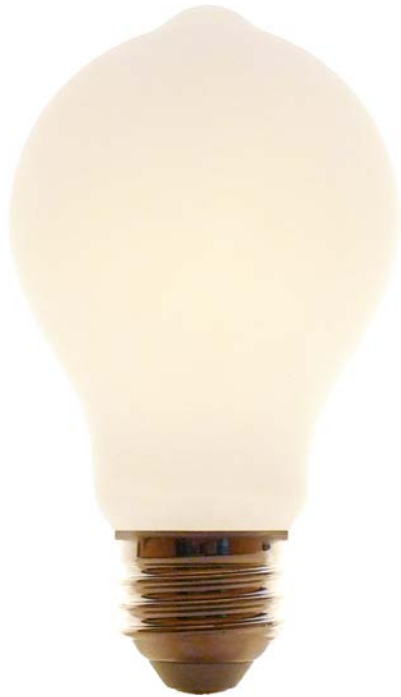
一般電球/ヴィンテージタイプ A60F-6.5WD9227-E26 (フロスト)