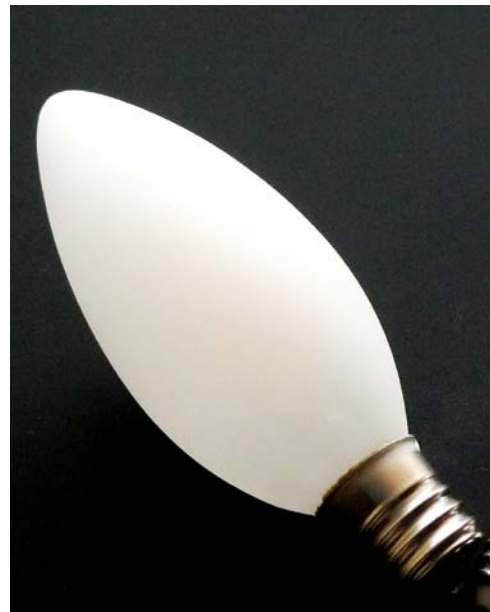
シャンデリア球タイプ C35F-3.5WD9227-E17 (フロスト)